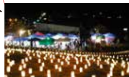
毎月第3日曜に開催されている「たいし聖徳市」が夜市として協力開催