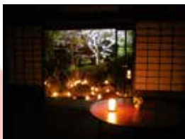
西方院は、聖徳太子の3人の乳母、月益姫・日益姫・玉照姫（それぞれ蘇我馬子・小野妹子・物部守屋の娘とされる）が、太子の冥福を祈るために尼となり創始したと伝えられています