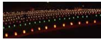
聖徳太子の五字ヶ峯伝承をもとに、5色の瑞光を表現しています