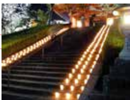
叡福寺は、聖徳太子廟を守護するために、推古天皇により建立された香華所が起源と伝えられています