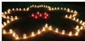
境内東側では桜と今年の干支を表現する予定です