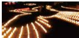
金堂前では「鳳凰」がお出迎えます