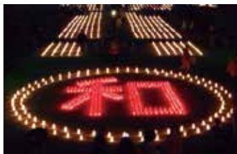
太子の教え「和をもって貴しと為す」を「和」の文字で表現しています