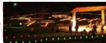
野外ステージとふれあい交流広場