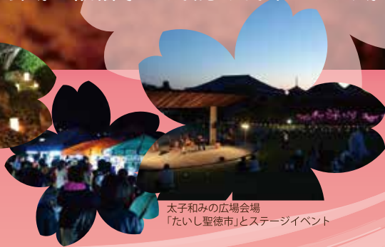
太子和みの広場会場 「たいし聖徳市」とステージイベント

主催 太子聖燈会の会・協力 叡福寺 西方院 後援 太子町 太子町教育委員会 大阪府 大阪観光局 華やいで大阪・南河内観光キャンペーン協議会 近畿日本鉄道株式会社 (順不同) 協賛 大阪南農業協同組合 たいし聖徳市