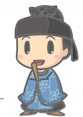
大阪府太子町公式マスコットキャラクター たいしくん

近鉄「上ノ太子駅」から太子町役場までは約2.2km 徒歩約25分・車で約8分だよ。目安にしてね!